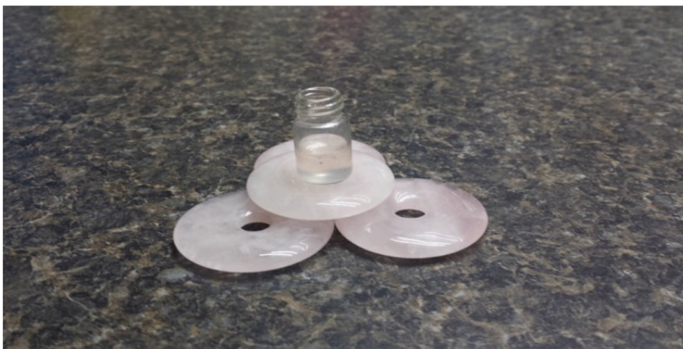
Abbildung 1: Expositionssystem für DNA-Lösung auf EE-Medaillons

Die Daten wurden zur Analyse in ein Excel-Tabellenblatt übertragen. Aufgrund eines Phänomens, das als Frequenzsprung bekannt ist (Drichko 2000), kann die Amplitude (Stärke) der induzierten Stromantwort bei einer bestimmten Frequenz nicht wie bei normalen spektroskopischen Techniken gemessen werden. Daher wurde gemessen, wie oft das induzierte Signal bei jeder Anregungsfrequenz auftrat (prozentuales Auftreten), um die Eigenfrequenzen der DNA zu bestimmen. Der Prozentsatz des Auftretens ist ein Maß für die Signalstärke bei jeder Frequenz.